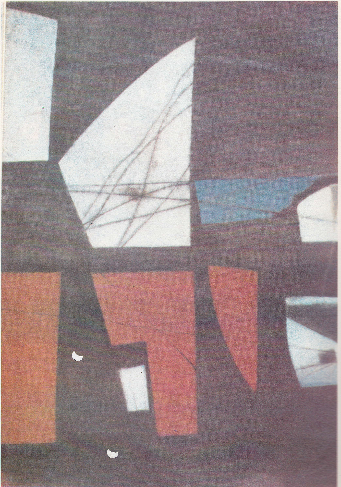
٨ - فائق حسن ( مجموعة المتحف الوطني للفن الحديث )