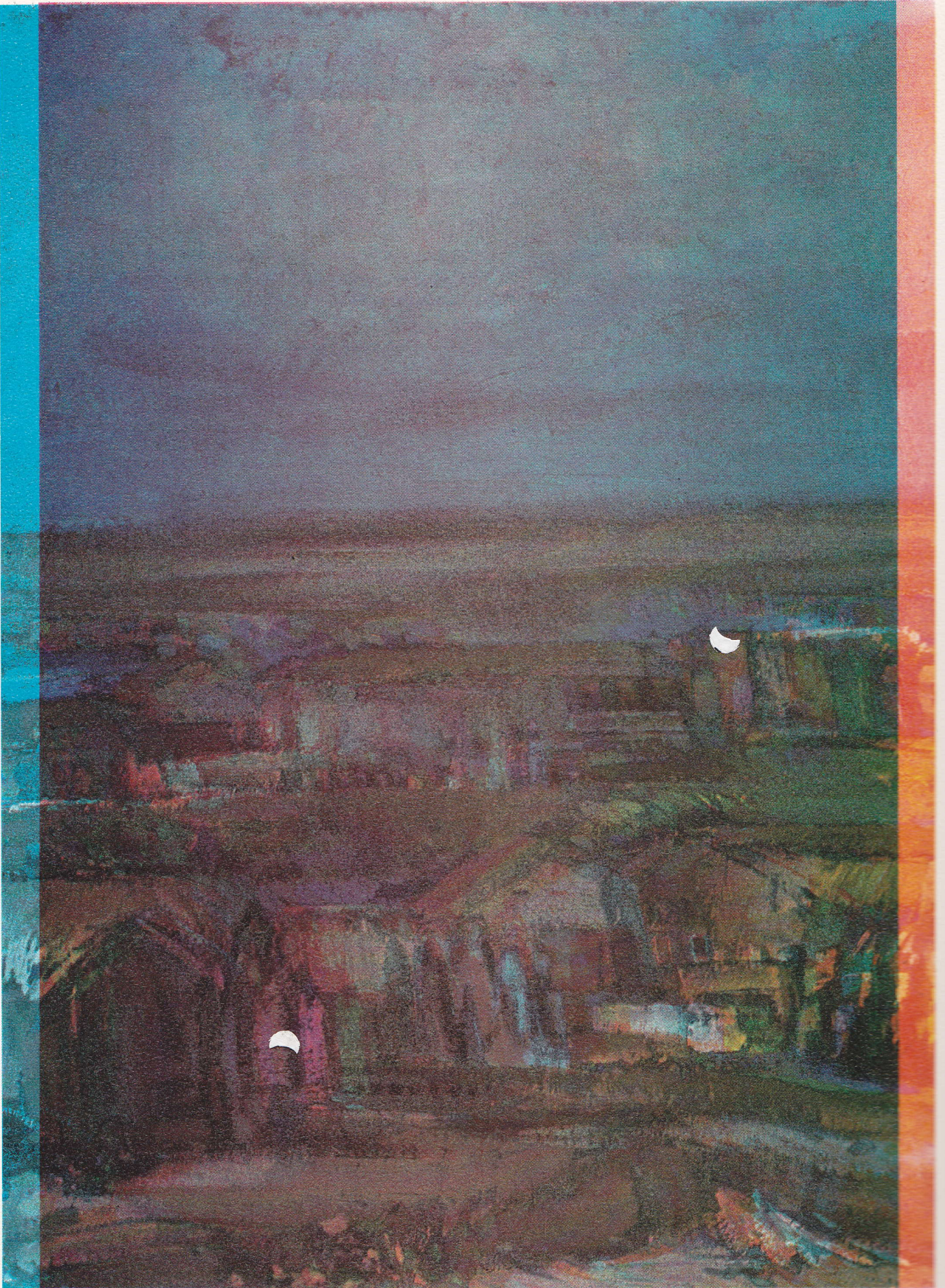
٩ - خالد الجادر ( مجموعة المتحف الوطني للفن الحديث )