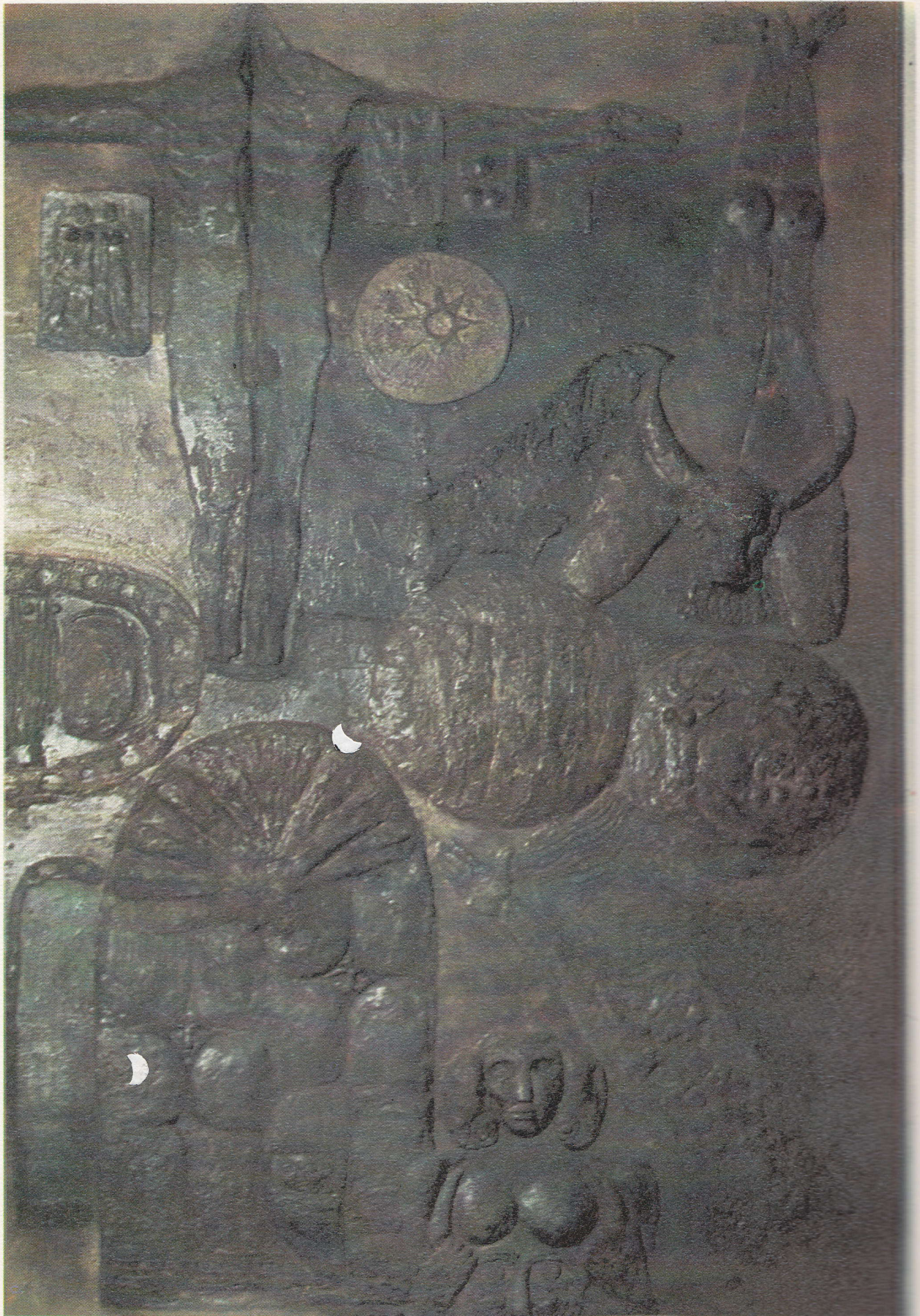
٢١ ١٠- حميد العطار ( مجموعة المتحف الوطني للفن الحديث )