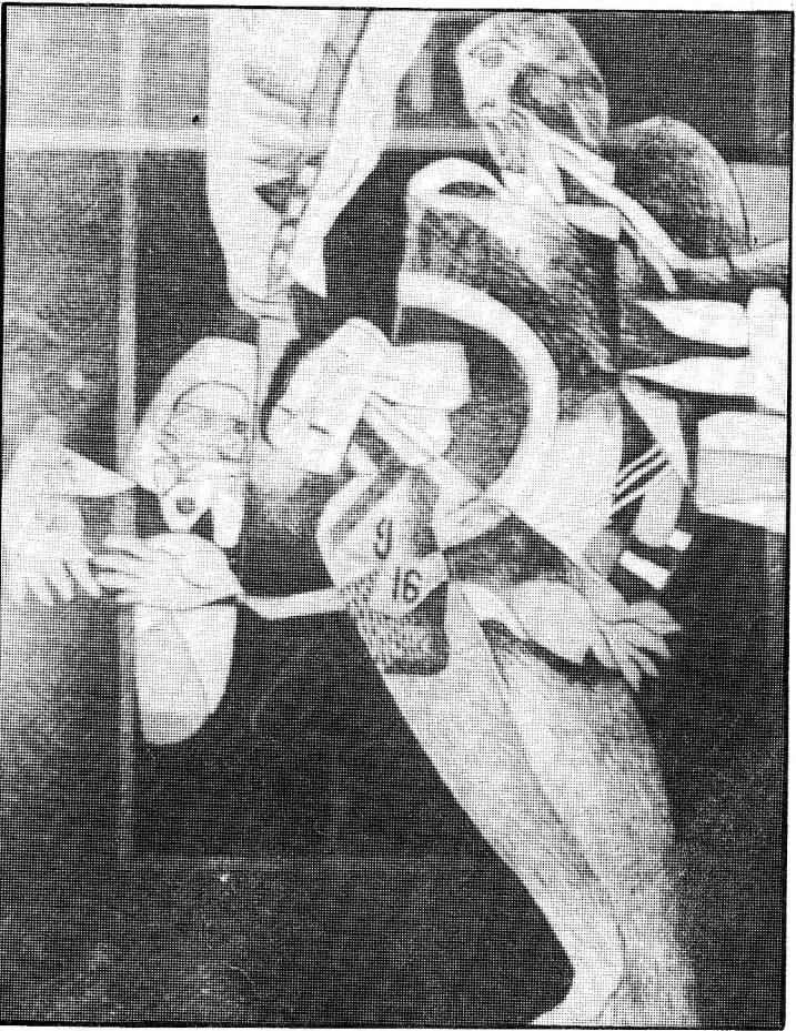
● لوحة تعبر عن بشاعة الحرب واشلاء الجنث البشرية .