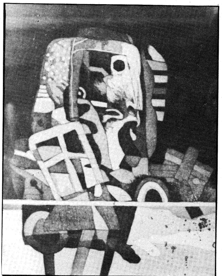
● حطام هائل يضم الخراب والدمار بعد المذبحة