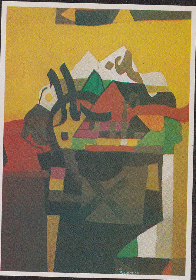
مشهد حروفي (١٩٨٤)

العزاوي: ان اهتمامي باستخدام الحرف العربي كوحدة فنية تعبير عن انحيازي الثقافي والفني ورغبتني في بناء لوحة ذات خصوصية تعود لتقاليدنا وموروثنا الوطني. ولانني