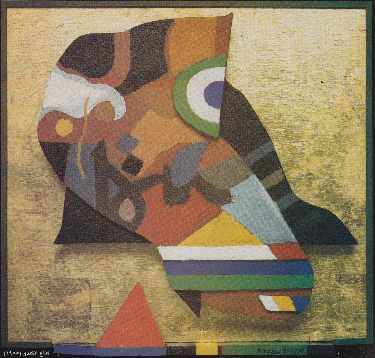
قناع انكيديو (١٩٨٥)

رغم رسمه للمعلقات إلا أنه ضد الحروفية ضياء العزاوي لـ «الافق»: